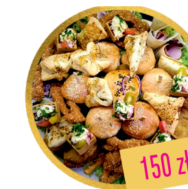
DESKA SOLE MIO (własna kompozycja)