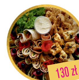
DESKA PRZEKĄSKOWA (z opcją wege)