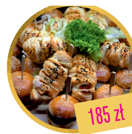
DESKA BURGER X HOT-DOG