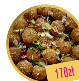
DESKA BURGER lub DESKA HOT-DOG (z opcją wege)